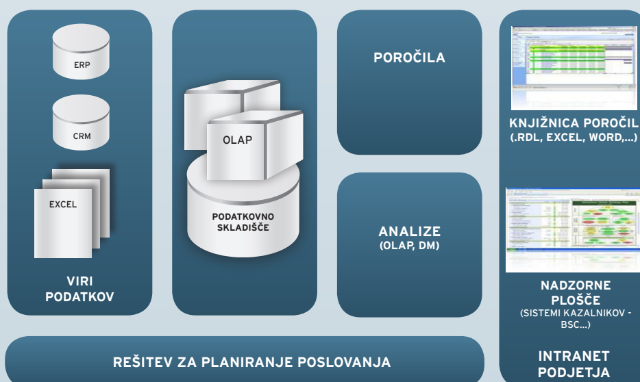
Slika: Shema celovitega sistema poslovne inteligence

Celovit sistem poslovne inteligence mora podpirati vse tri stebre upravljanja učinkovitosti poslovanja, zato rešitev add.BI nudi učinkovito načrtovanje, analize in spremljanje poslovanja .